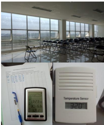
Gambar 2. Interior Gedung Kuliah Kota Bandar Lampung, termometer ruang, dan sensor.

Data-data temperatur di ambil dengan menggunakan alat pengukur suhu yaitu Termometer ruang dengan dilengkapi sebuah sensor yang dapat diletakkan di luar ruangan dengan jarak maksimum 100 meter. Waktu pengambilan data yaitu Jam 13.16-13.47.