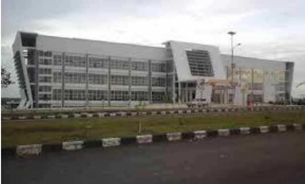
Gambar 1. Gedung Kuliah Kota Bandar Lampung, ITERA Data tentang Suhu Dalam dan Suhu Luar Gedung E ITERA

Gedung Kuliah Kota Bandar Lampung adalah bangunan empat lantai yang digunakan sebagai gedung kuliah, gedung yang terletak di kawasan pendidikan kampus ITERA, Lampung Selatan berjumlah 4 lantai, yaitu terdiri dari 1 lantai semi basement, 3 lantai tipikal, dan 1 lantai atap (roof top). Mengingat gedung ini merupakan gedung kuliah, jadi ada beberapa lantai yang tipikal.